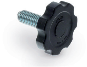
ELESA Original design